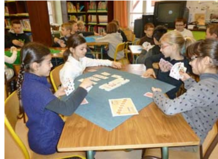
Ces bridgeurs en herbe ont à peine une dizaine d'années...

C'est facile d'enseigner le bridge à des enfants jeunes, ils comprennent tout de suite et mémorisent les règles mieux que certains adultes. Le plaisir du jeu est constant. Me connaissant déjà - car j'aide depuis l'année dernière différents enseignants de cette école où mes petits-enfants sont scolarisés - ils m'ont très bien acceptée et me respectent, ce qui donne des séances vivantes, dans une bonne ambiance, sans chahut. Les parents, pour l'ensemble, se sont montrés intéressés. J'ai installé une table de bridge lors d'une soirée "crêpes-jeux" organisée par l'association de parents d'élèves dans le village. Mon but est de pouvoir continuer au collège qui est proche ; d'ailleurs, je suis en contact avec la Principale pour une entrée éventuelle dans son établissement en septembre 2011. ». A suivre !