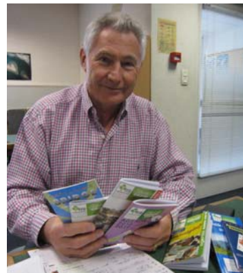
Agenda en préparation...

- L'agenda comité de la rentrée est en préparation. Vos remarques ont été prises en compte, il sera plus beau et encore plus pratique.