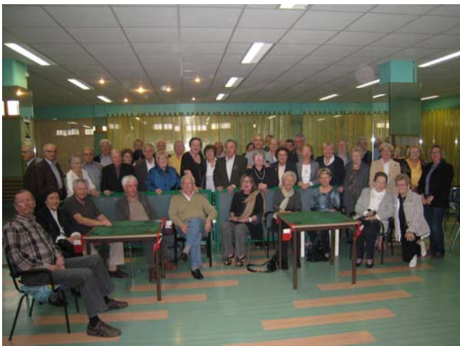
Les membres ont posé pour la photo de famille.