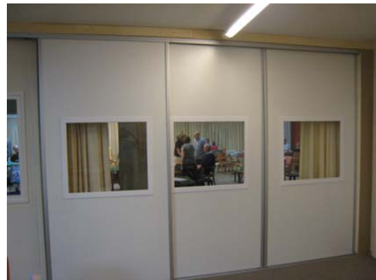
La nouvelle porte de séparation.

Les compétiteurs de la Maison du Bridge peuvent apprécier depuis le mois dernier la séparation entre salle ouverte et fermée. Cette cloison, composée de portes coulissantes, laisse passer la lumière et permet de jouer sereinement même quand se côtoient dans la journée un tournoi de régularité d'un côté et une finale de comité de l'autre.